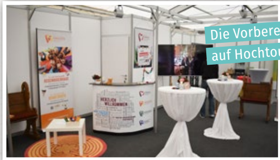
Die Vorbereitungen laufen auf Hochtouren ...