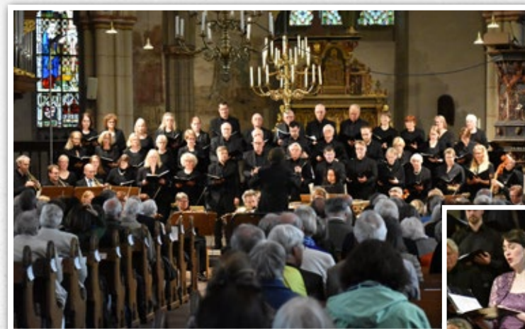
Barocke Pracht: Meisterwerke von Händel und Bach mit tollen Solisten erfüllten die Martinikirche.