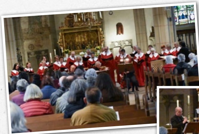
Feierliche Klänge an den Ostertagen: Fagott, Geige, Orgel, Klavier und Posaunen berührten die Herzen.