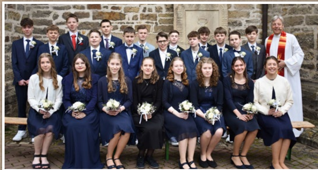
22 Jugendliche feierten im April Konfirmation