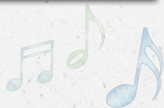
Kino für die Ohren: Die St. Martini Brass Band begeisterte mit nahezu epischer Filmmusik z. B. von „Jurassic Park“.