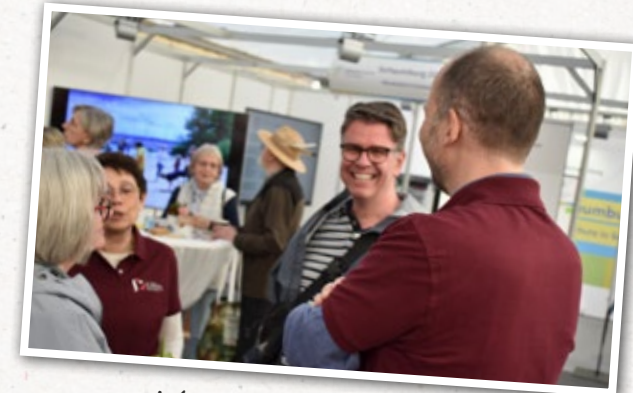
Die Stimmung ist bestens, es wird viel gelacht.