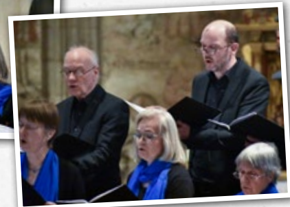
Evensong: Stimme und Stille des Evensong- Abendgebets, Momente der inneren Einkehr.