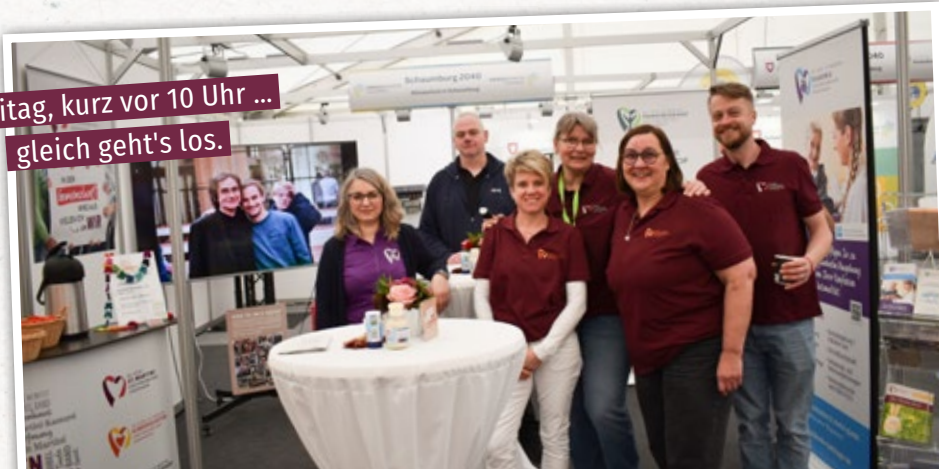
Freitag, kurz vor 10 Uhr ... gleich geht's los.

Mehrere Roll-ups, Plakate, eine Theke, ein großer Bildschirm, Kirchenbänke, eine Kinderecke samt Spielzeug, Stehtische, Prospektständer etc. wurden so lange gerückt, bis das Aufbau-Team zufrieden auf einen toll eingerichteten Messestand blickte.