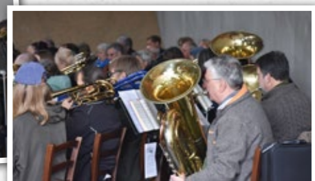
Himmelfahrt: Über 60 Bläserinnen und Bläser von jung bis alt musizierten gemeinsam in der großen Scheune auf dem Schäferhof.