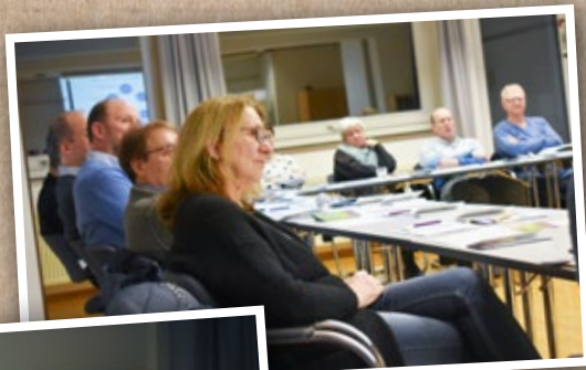
GKR-Wochenende im Lutherheim Springe