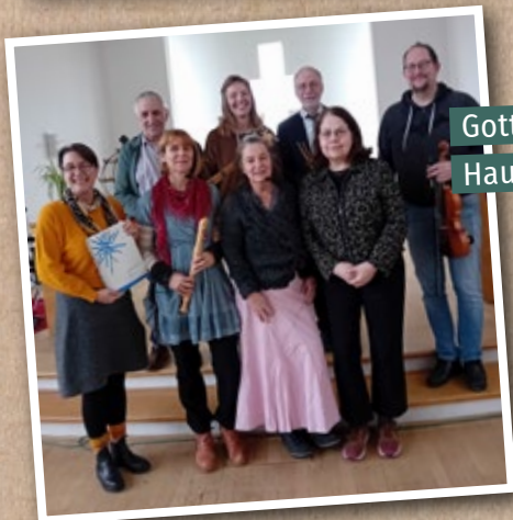
Gottesdienst im Jakob-Dammann-Haus mit der Gruppe AufLeben