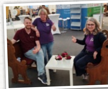
Zwei Kirchenbänke laden zum Gespräch oder Verweilen ein.